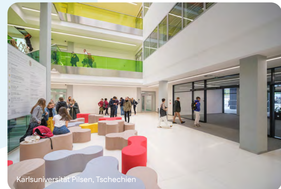
Karlsuniversität Pilsen, Tschechien