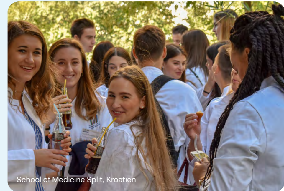
School of Medicine Split, Kroatien