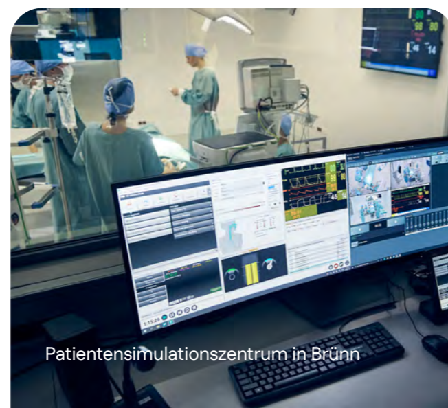
Patientensimulationszentrum in Brunn