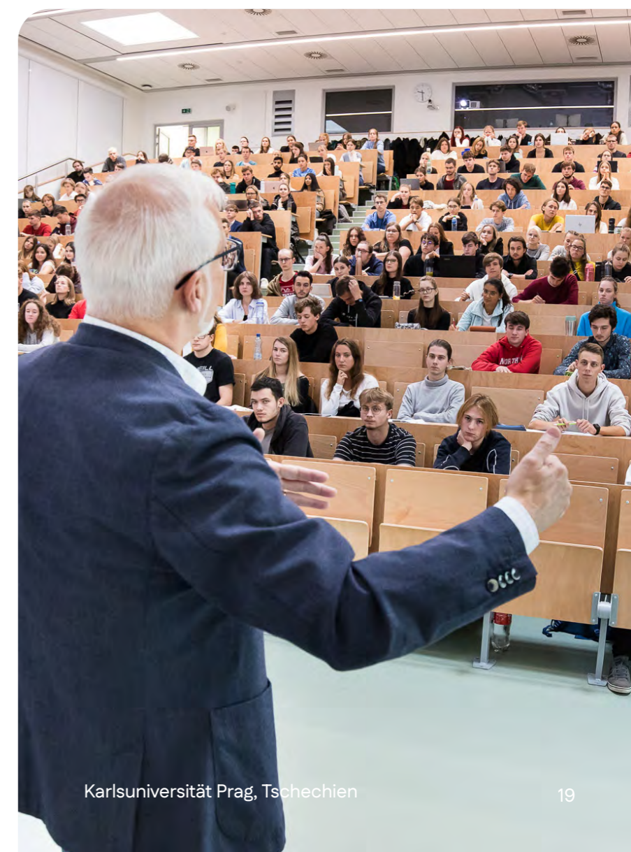
Karlsuniversität Prag, Tschechien