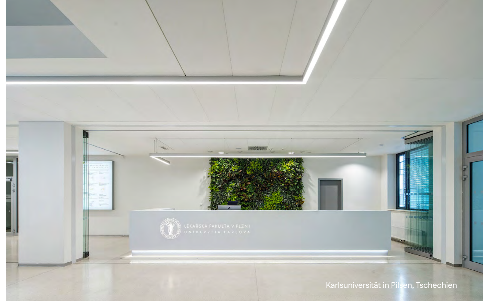
Karlsuniversität in Pilsen, Tschechien

Was alle unsere Partneruniversitäten gemeinsam haben: Sie sind ganz vorne in vielen Rankings und unsere Absolvent:innen lassen regelmäßig von sich hören. Und von der einzigartigen Atmosphäre der Städte, in denen wir Studienplätze vermitteln, profitierst du nicht nur, wenn es um das reine Studium geht.