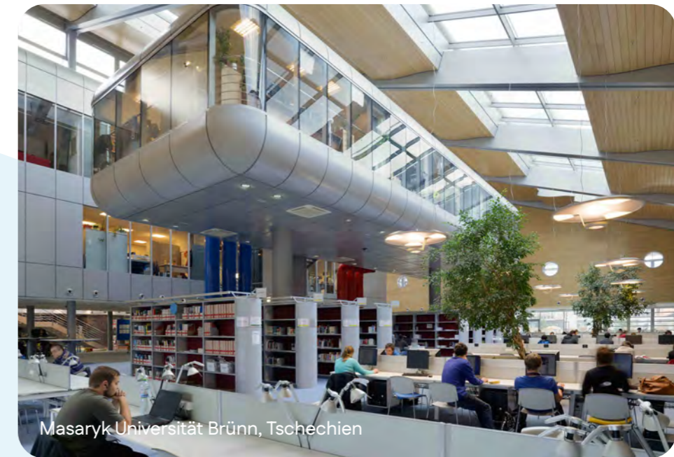
Masaryk Universität Brunn, Tschechien

Deshalb ist ein EU-Medizinstudium auch ohne weitere Beschränkungen EU-weit anerkannt. Wer seinen Abschluss an einer unserer Partneruniversitäten macht, kann im Anschluss in jedem EU-Land praktizieren. Ohne Wenn und Aber.