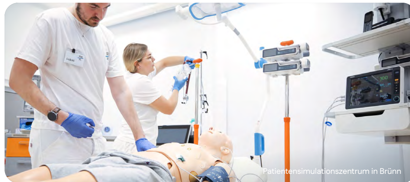
Patientensimulationszentrum in Brunn